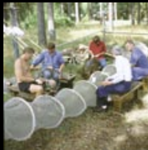
Gillesgänget bödar hommar.

Ålen fångas i ålahomnor på sin mystiska vandring till Sargassohavet. Ålen är en av de få arter som fortfarande har hemligheter för människan. Inget vet helt säkert hur ålen lever och vandrar. Men vi vet att den varje år passerar Åhus och Ålakusten. Det är då vi ställer med ålagille. Och därför är det bara här du kan uppleva ett äkta ålagille.